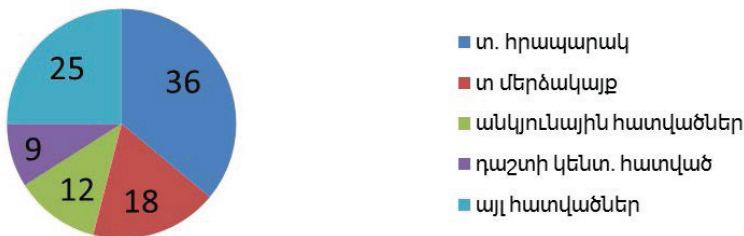
Նկար 1. Մրցավարների սխալներն ըստ խաղադաշտի հատվածի

Բերված օրինակներն ու տեսադիտման մեթոդով ԱԱ 64 հանդիպումների մեր ուսումնասիրությունները փաստում են, որ աշխարհի առաջնությունում մրցավարներն առավել շատ սխալներ են թույլ տվել տուգանային հրապարակում (Տես նկ. 1-ում):