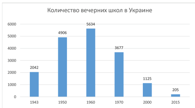
Рис. 1. Количество вечерних школ в Украине (выборка по годам)

Важным является тот факт, что сеть вечерних школ в Украине сформировалась еще с 1943 года. В годы войны, особенно в первые послевоенные десятилетия, была особенная необходимость в доучивании фронтовиков, недоучившихся из-за войны детей и работников, которые возрождали экономику страны (рис. 1) [1].